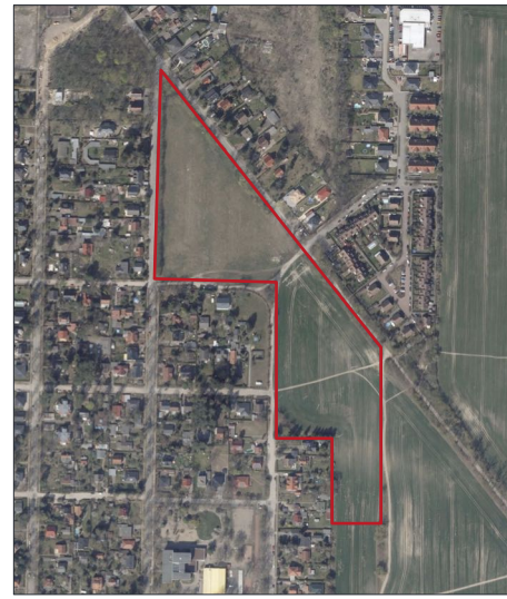
Orthophoto | o. M.

https://www.geoportal-schoeneiche-bei-berlin.de/viewer2.php? | Abruf am 10.10.23 mit eigener Ergänzung