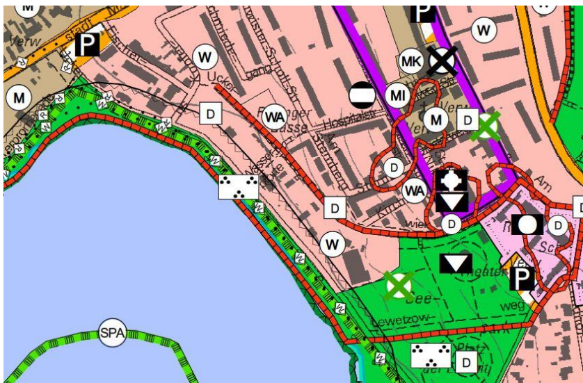
Abbildung 1: Auszug aus dem rechtswirksamen Flächennutzungsplan

Im rechtswirksamen FNP wird das Plangebiet als Wohnbaufläche (W) dargestellt. Somit entspricht der Bebauungsplan mit dem geplanten allgemeinen Wohngebiet dem Entwicklungsgebot des § 8 Abs. 2 BauGB.